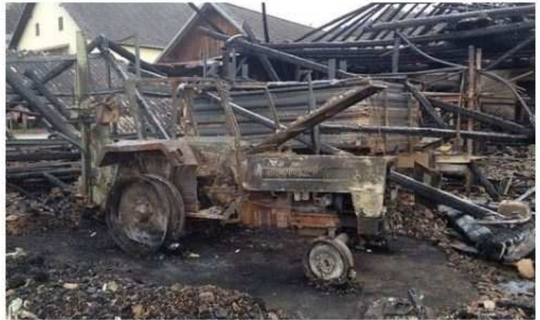
Brandursache ist Kurzschluss der Batterie eines Traktors

Der Brand vernichtete zwei Traktoren, darunter ein neueres Modell, sowie andere Arbeitsgeräte und rund 100 Tonnen Futtermais. Die Schadenssumme beläuft sich auf rund 250.000 Euro.