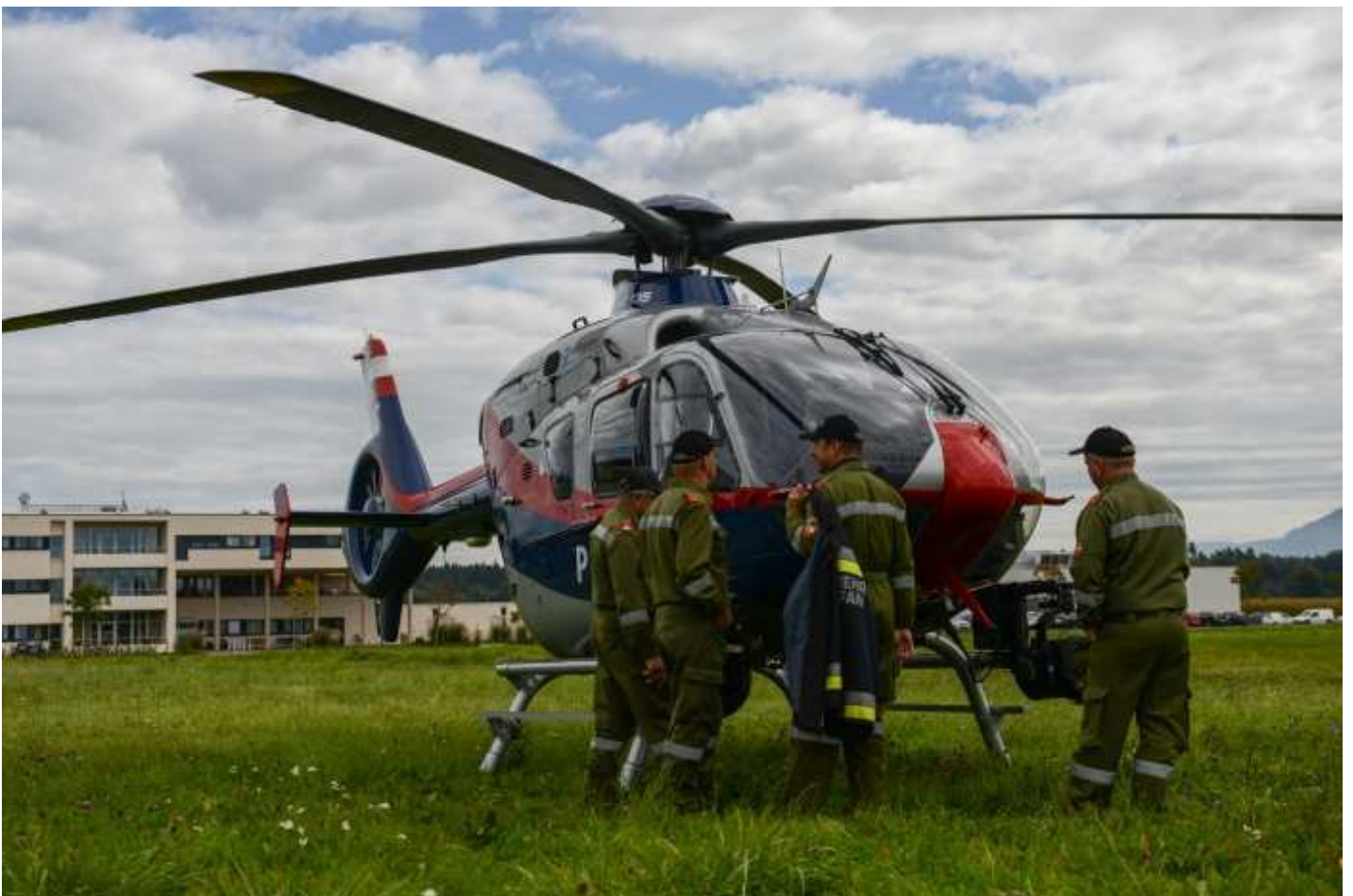
Einsatzhubschrauber des BMI