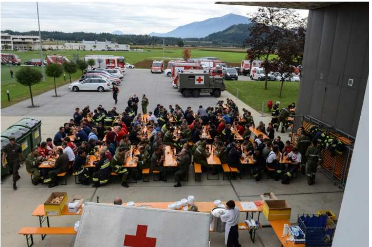
Verköstigung in der NMS Kühnsdorf