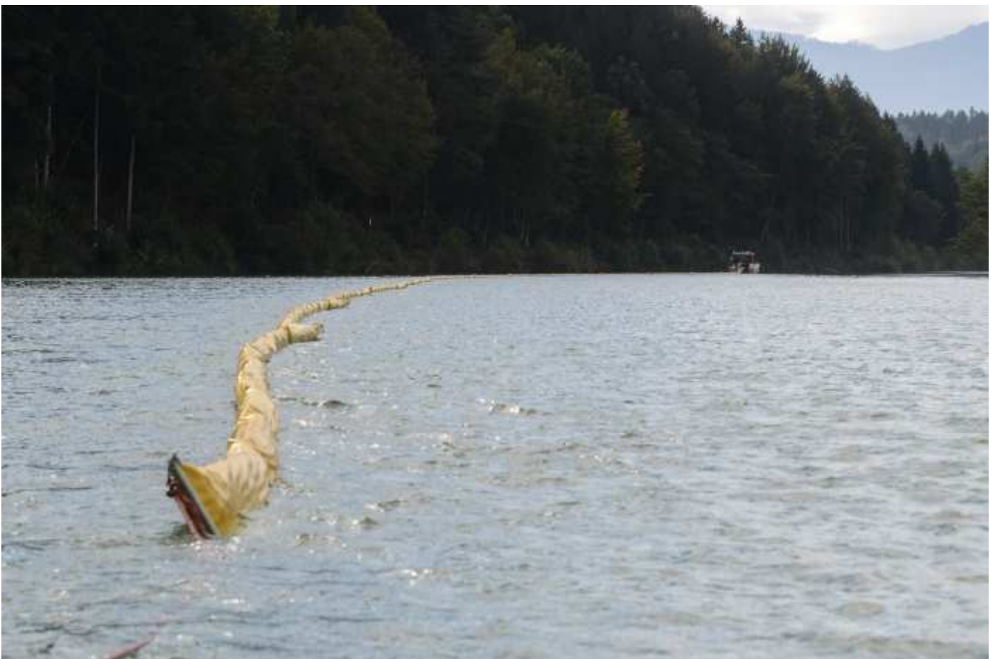
Aufziehen von Ölsperren auf der Drau