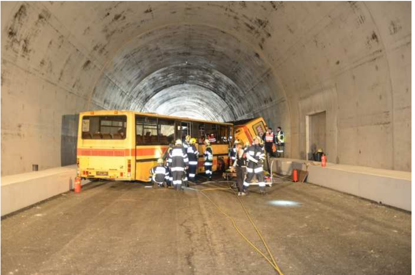
Simuliertes Zugunglück im Tunnel / Kühnsdorf