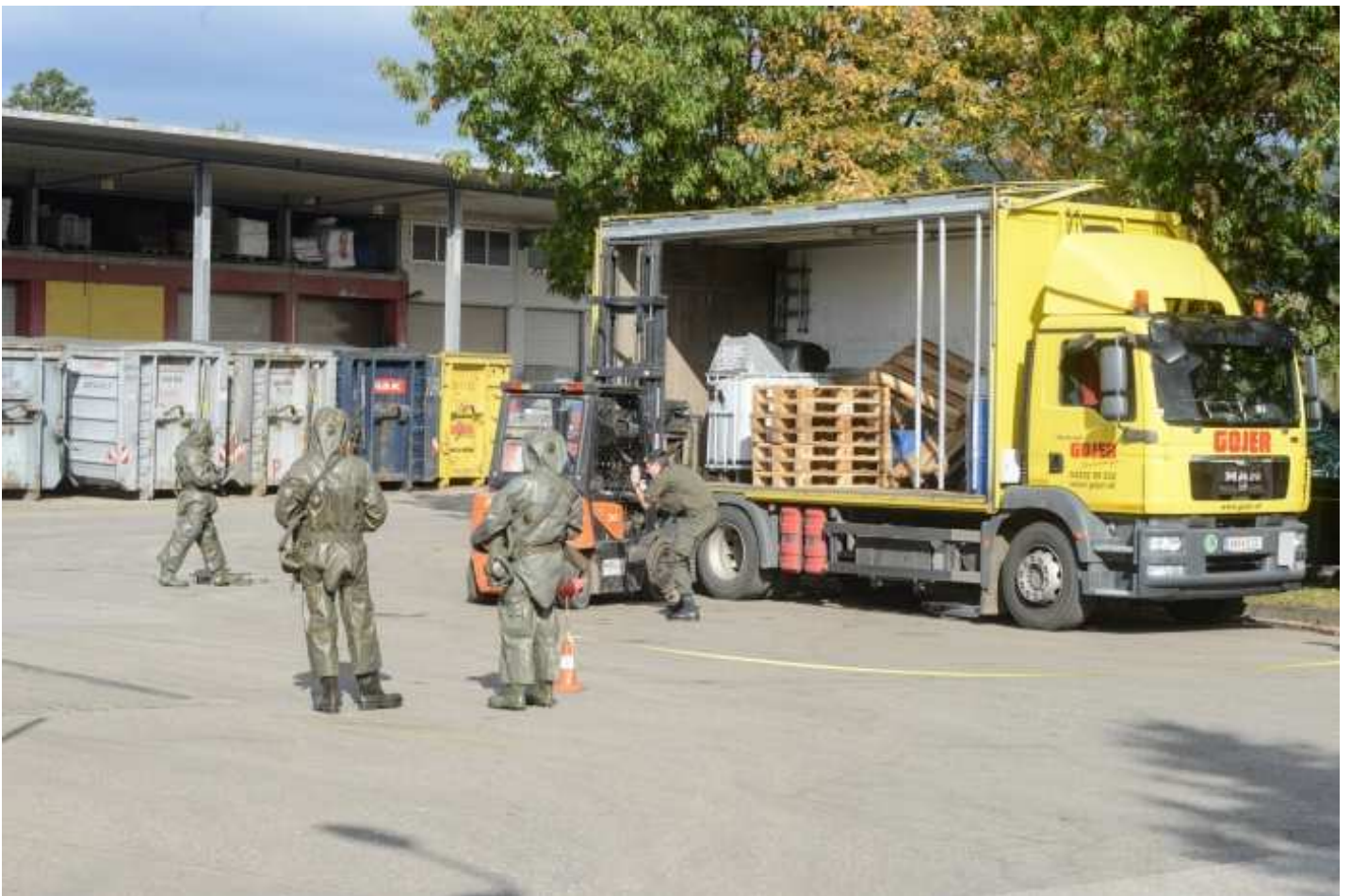
Chemieunfall Fa. Gojer