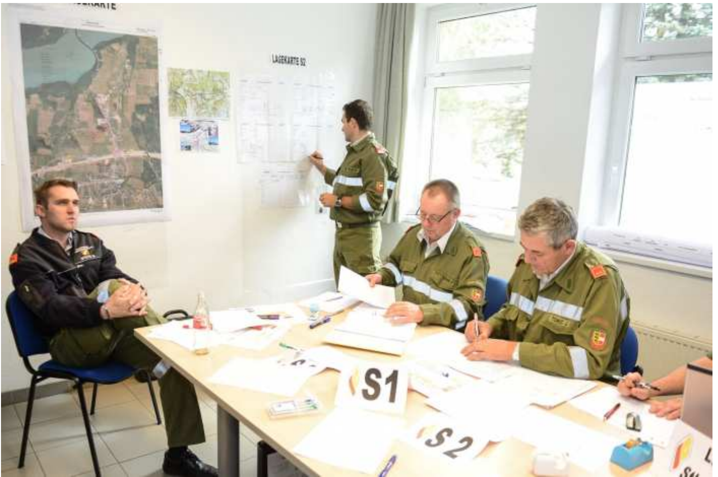
Einsatzstab in der BAWZ Völkermarkt