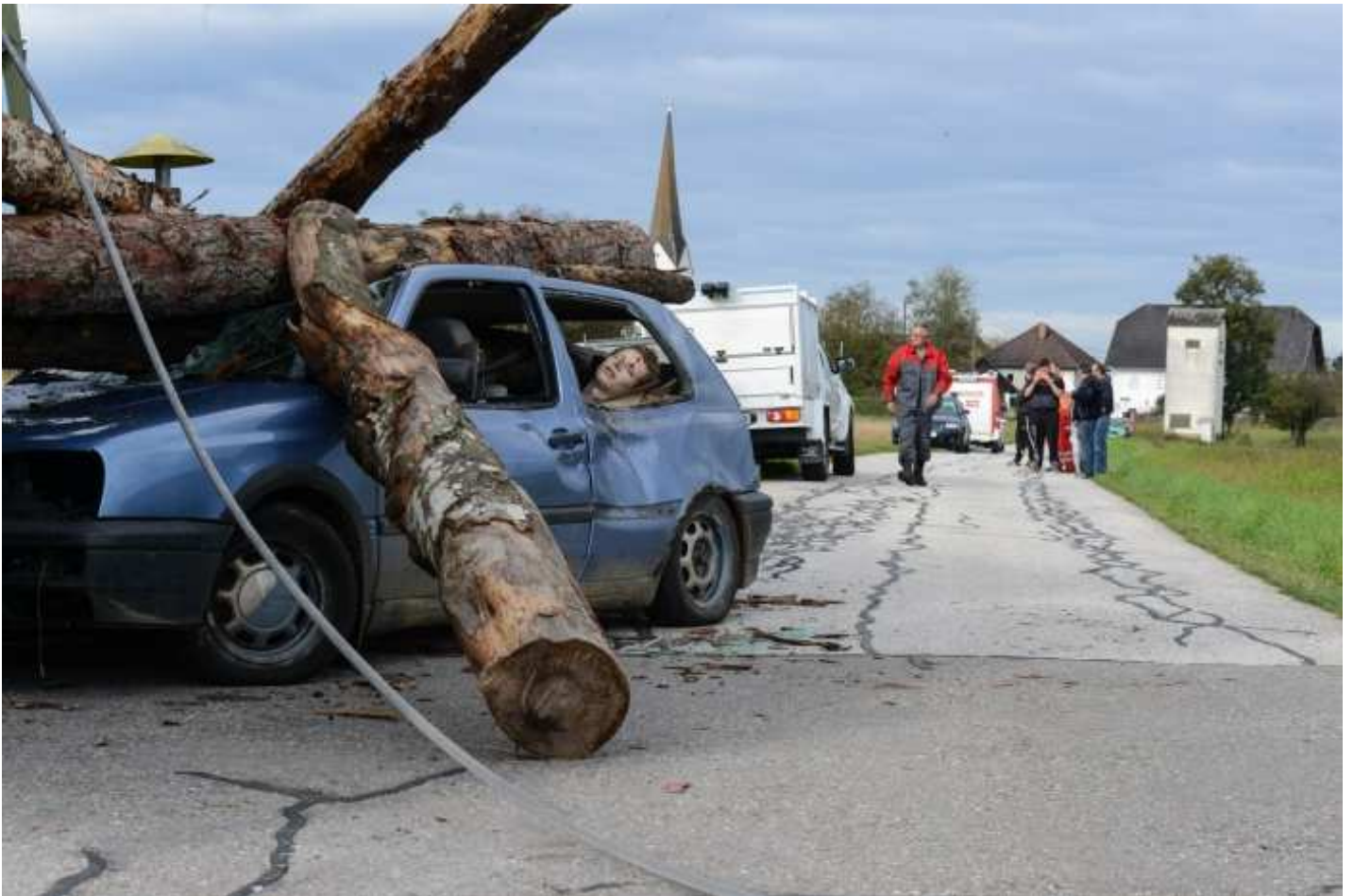
Schwerer Verkehrsunfall (LKW gegen PKW) und Crash gegen Hochspannungsleitung der APG